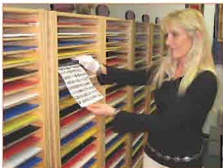
Fotos worden gedigitaliseerd en gebruikt om balancerende energie te ontvangen.

Als AIM deelnemer heeft u toegang tot duizenden balancerende frekwenties, 24 uur per dag, 7 dagen per week.